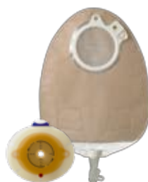
SenSura Click 2-delsbandage