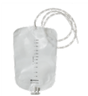
Coloplast Uro Nattpåse