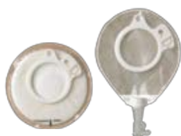
Coloplast Uro Minicap och Coloplast Uro Micropåse