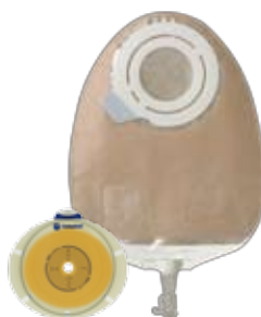
SenSura Flex 2-delsbandage